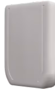
Daikin zu AC Cloud Control - 1 Inneneinheit

Das AC Cloud Control-Gerät für Daikin ermöglicht eine vollständige und natürliche Integration von Daikin-Domestic-Klimageräten in das AC Cloud Control-System für eine professionelle HLK-Steuerung und -Überwachung über eine native Android/iOS-App oder ein Web-Dashboard. Die Konfiguration erfolgt über WLAN oder Bluetooth.