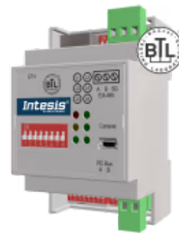
Hitachi zu BACnet/IP & MS/TP

Die Hitachi-BACnet-Schnittstelle ermöglicht eine vollständige bidirektionale Kommunikation zwischen Hitachi VRF-Einheiten und BACnet/IP- oder MS/TP-Netzwerken. Die Schnittstelle ermöglicht die BACnet-Kommunikation über Polling oder Subscription Requests (COV), wodurch die Inneneinheit über unabhängige BACnet-Objekte verfügbar wird. Es kann auch eine kabelgebundene Fernbedienung angeschlossen werden.