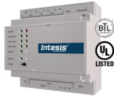
M-BUS 转 BACnet/IP 和 MS/TP

将任何 M-Bus 设备与 BACnet BMS 或任何 BACnet IP 或 BACnet MS/TP 控制器集成。这种集成旨在使 M-Bus 设备、其寄存器和资源可以从基于 BACnet 的控制系统或设备进行访问，就好像它们是 BACnet 系统的一部分一样，反之亦然。