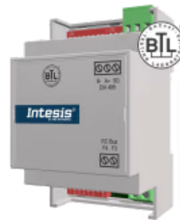
Samsung zu BACnet MS/TP

Die Samsung BACnet-Schnittstelle ermöglicht eine vollständige bidirektionale Kommunikation zwischen den Inneneinheiten der Samsung-NASA-Klimaanlage und BACnet MS/TP-Netzwerken. Es ermöglicht die BACnet-Kommunikation über Polling oder Subscription Requests (COV), wodurch die Inneneinheit über unabhängige BACnet-Objekte verfügbar wird. Es kann auch eine kabelgebundene Fernbedienung angeschlossen werden.