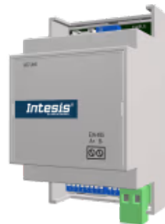
Panasonic zu Modbus - 1 Inneneinheit

Die Panasonic-Modbus-Schnittstelle ermöglicht eine vollständige bidirektionale Kommunikation zwischen Panasonic Etherea-Klimageräten und Modbus RTU-Netzwerken (RS-485). Die Schnittstelle fungiert als Servergerät für die Installation und greift auf alle Signale des Klimageräts zu.