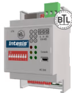
Panasonic zu BACnet/IP & MS/TP

Die Panasonic-BACnet-Schnittstelle ermöglicht eine vollständige bidirektionale Kommunikation zwischen Panasonic Etherea-Klimageräten und BACnet/IP- oder MS/TP-Netzwerken. Die Schnittstelle ermöglicht die BACnet-Kommunikation über Polling oder Subscription Requests (COV), wodurch die Inneneinheit über unabhängige BACnet-Objekte verfügbar wird.