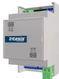
Panasonic zu Modbus RTU - 1 Inneneinheit

Die Panasonic-Modbus-Schnittstelle ermöglicht eine vollständige bidirektionale Kommunikation zwischen Panasonic ECOi- und PACi-Klimageräten und Modbus RTU-Netzwerken (RS-485). Die Schnittstelle fungiert als Servergerät für die Installation und greift auf alle Signale des Klimageräts zu. Auch eine kabelgebundene Fernbedienung kann Teil des Netzwerks sein.