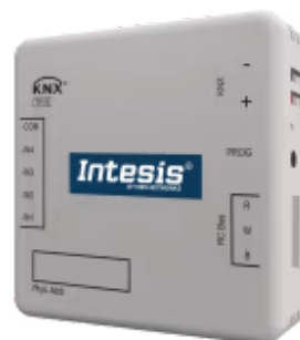
Fujitsu zu KNX

Die Fujitsu-KNX-Schnittstelle ermöglicht eine vollständige bidirektionale Kommunikation zwischen Fujitsu RAC- und VRF-Einheiten und KNX-Installationen. Sie verfügt über vier potentialfreie Binäreingänge zur Einbindung externer Geräte (z. B. Fensterkontakte oder Präsenzmelder) mit den entsprechenden internen Funktionen zur Verbesserung der Energieeffizienz.