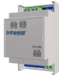
Bosch Commercial zu Modbus RTU

Das Bosch-Modbus-Gateway ermöglicht die bidirektionale Kommunikation zwischen Bosch-Commercial- und VRF-Systemen sowie Modbus RTU-Netzwerken (RS-485) und ermöglicht die vollständige Steuerung und Überwachung des Klimageräts über seine internen Variablen.