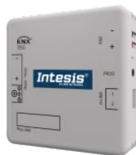
Hitachi zu KNX - 1 AW Inneneinheit

Die Hitachi-KNX-Schnittstelle ermöglicht eine vollständige bidirektionale Kommunikation zwischen Hitachi Air to Water Klimageräten und KNX-Installationen. Er wird direkt an die Inneneinheit angeschlossen und bietet vollständige Interoperabilität mit KNX.