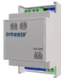
Bosch Commercial zu Modbus RTU - 8 Innengeräte

Das Bosch-Modbus-Gateway ermöglicht die bidirektionale Kommunikation zwischen Bosch-Commercial- und VRF-Systemen sowie Modbus RTU-Netzwerken (RS-485) und ermöglicht die vollständige Steuerung und Überwachung des Klimageräts über seine internen Variablen.