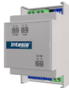
Samsung zu Modbus RTU - 1 Inneneinheit

Die Samsung-Modbus-Schnittstelle ermöglicht eine vollständige bidirektionale Kommunikation zwischen Samsung NON-NASA-Klimageräten und Modbus RTU-Netzwerken (RS-485). Die Schnittstelle fungiert als Servergerät für die Installation und greift auf alle Signale des Klimageräts zu. Auch eine kabelgebundene Fernbedienung kann Teil des Netzwerks sein.