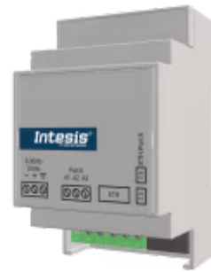
Modbus RTU zu Modbus TCP -32 Geräte

Integrieren Sie Geräte in einem Modbus RTU-Netzwerk mit einem Modbus-TCP-Netzwerk transparent mit unserem kompakten Modbus-Router. Diese Integration zielt darauf ab, Modbus RTU-Geräte, -Register und -Ressourcen für ein Modbus-TCP-Client-BMS oder einen Modbus-TCP-Controller zugänglich zu machen.