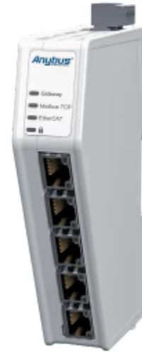
连接 Modbus-TCP 和 EtherCAT 控制系统的协议转换器

Anybus 网关 - Modbus-TCP服务器到EtherCAT从站使您能够将任何Modbus-TCP控制系统连接到任何EtherCAT控制系统。Anybus 网关可确保不同工业网络之间的可靠、安全、高速数据传输。得益于我们直观的基于 Web 的用户界面，它们也非常易于使用。