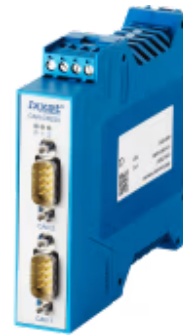
CAN Repeater mit 4 kV DC/4 kV AC galvanischer Trennung

Der Ixxat CAN-CR220 Repeater mit zwei CAN-Schnittstellen bietet eine galvanische Trennung bis zu 4 kV DC/4 kV AC für 1 Sekunde für einen verbesserten Schutz von Netzwerksegmenten. Er erhöht die CAN-Bus-Lastkapazität, stellt eine physikalische Kopplung von Bussystemen her und bietet die Flexibilität zur Optimierung von Netzwerkstrukturen. Der CAN-CR220 erfüllt die Norm DIN/EN 50178.