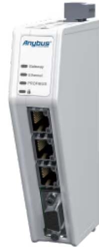
连接PROFIBUS DP和工业以太网控制系统的协议转换器

Anybus Communicator PROFIBUS DP Device to Common Ethernet使您能够将任何PROFIBUS DP控制系统连接到任何PROFINET、EtherCAT、Ethernet/IP或Modbus TCP控制系统。Anybus Communicator可确保不同工业网络之间可靠、安全、高速的数据传输。得益于我们直观的基于网络的用户界面，它们也非常易于使用。