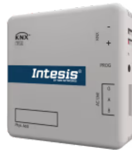
Haier zu KNX

Das Haier-KNX-Gateway ermöglicht die bidirektionale Kommunikation zwischen Haier Commercial- und VRF-Systemen sowie KNX-Installationen. Diese Kommunikation ermöglicht die vollständige Steuerung des Klimageräts über KNX, einschließlich der Überwachung der internen Variablen des Klimageräts, des Betriebsstundenzählers (zur Steuerung der Filterwartung) und der Fehlercodes.