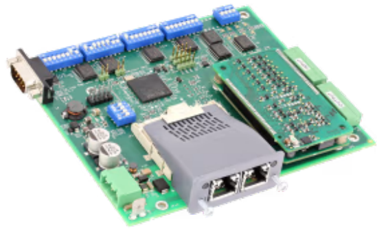
Sichere Kommunikation über PROFIsafe

Der Ixxat Safe T100/PS bietet eine einfache Möglichkeit, sichere I/O-Signale über das PROFIsafe-Protokoll in industrielle Geräte zu implementieren. Das Development Kit ist eine Komplettlösung für Evaluierungszwecke, die wesentliche Komponenten wie eine Basisplatine mit einem Anybus CompactCom-Modul, eine CPU und ein Sicherheitsmodul enthält.